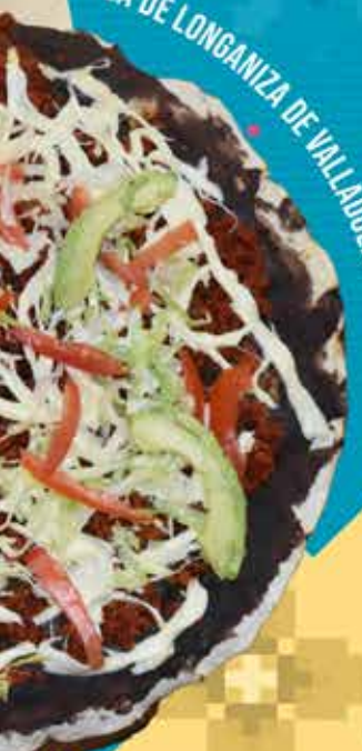
LA DE LONGANIZA DE VALLADOLID