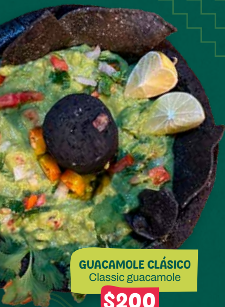
GUACAMOLE CLÁSICO Classic guacamole