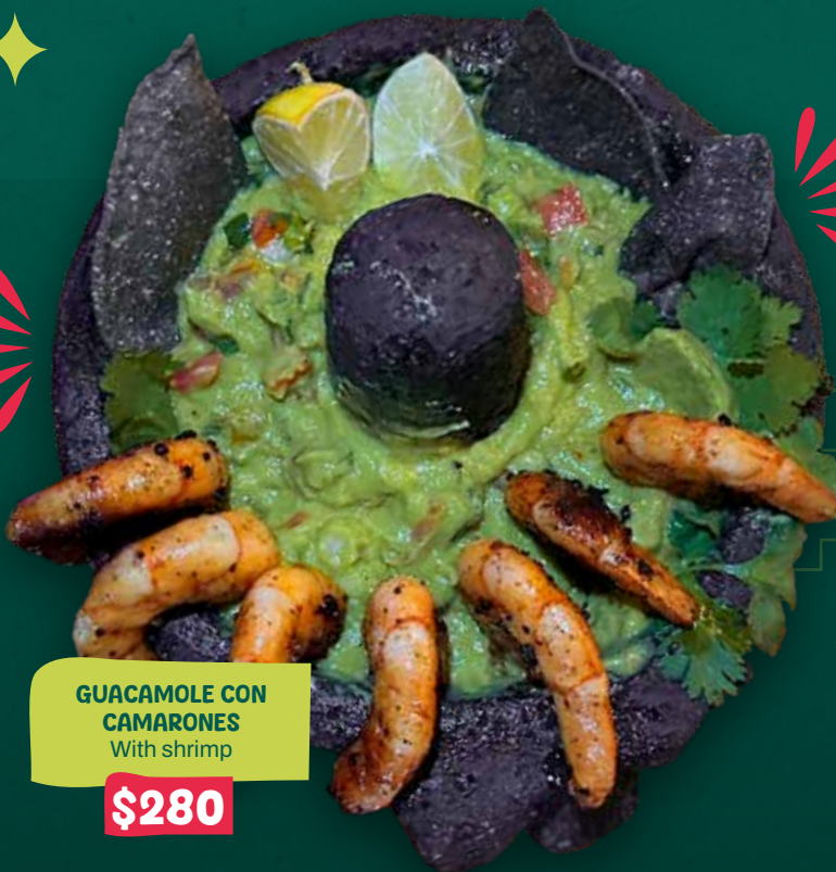
GUACAMOLE CON CAMARONES With shrimp