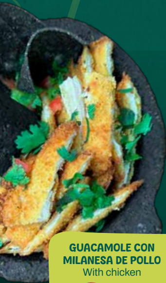
GUACAMOLE CON MILANESA DE POLLO With chicken