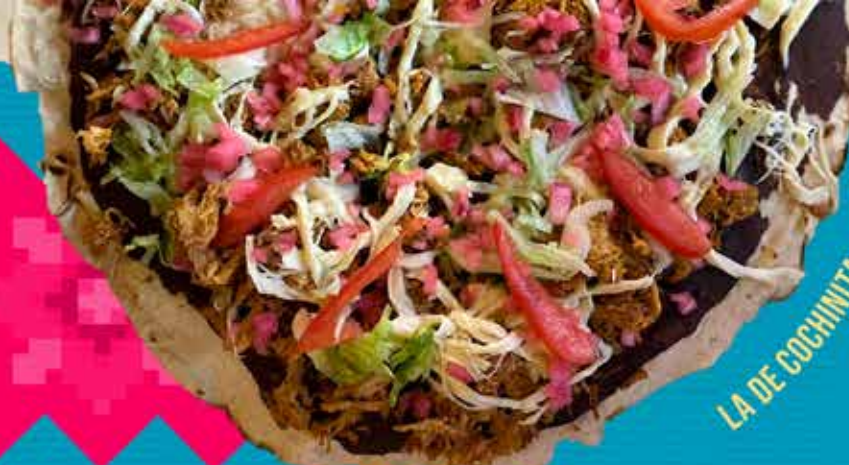
LA DE COCHINITA