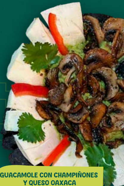
GUACAMOLE CON CHAMPIÑONES Y QUESO OAXACA