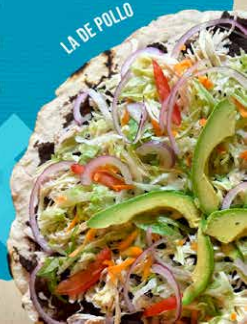
LA DE POLLO