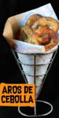
AROS DE CEBOLLA