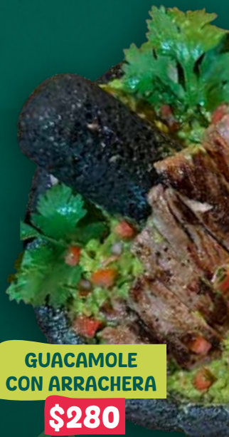
GUACAMOLE CON ARRACHERA