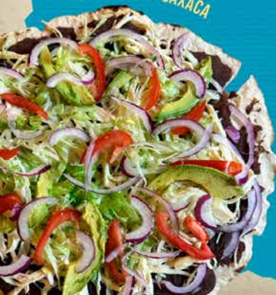
LA DE QUESO OAXACA